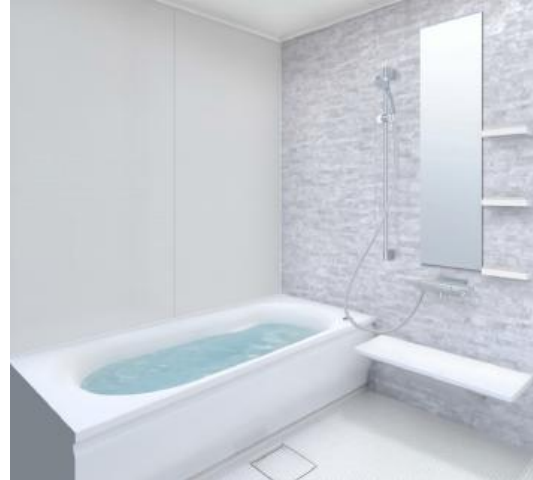
TOTO サザナHS Tタイプ