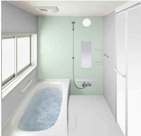
Panasonic AWE ソシエV Eタイプ