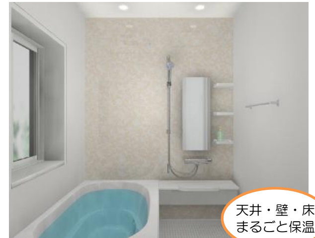
LIXIL リモア KDタイプ